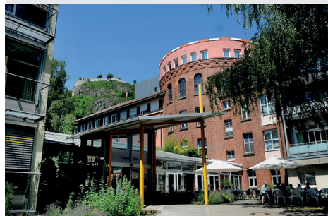
Oben: Hegau-Bodensee Klinikum in Singen mit seiner regionalen Stroke Unit

Die Abklärung und Therapie immunologischer Erkrankungen, tumorassoziierter Erkrankungen, komplexe kardiologische Fragestellungen und die gemeinsame Versorgung von Patienten mit Gefäßchirurgen und Neurochirurgen stellen eine moderne Betreuung neurologischer Patienten sicher.