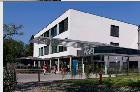
Rechts: Klinikum Konstanz mit seiner lokalen Schlaganfallstation