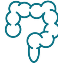
Gastrointestinale Tumore Speiseröhre, Magen, Dün- und Dickdarm, Pankreas, Leber und Gallengänge